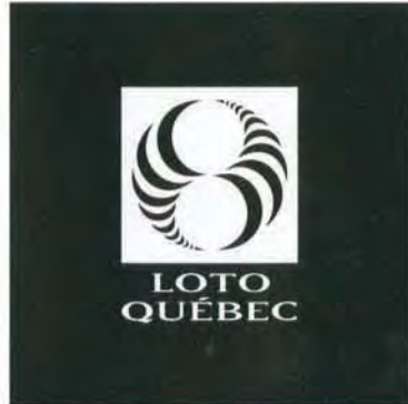
Version noire inversée