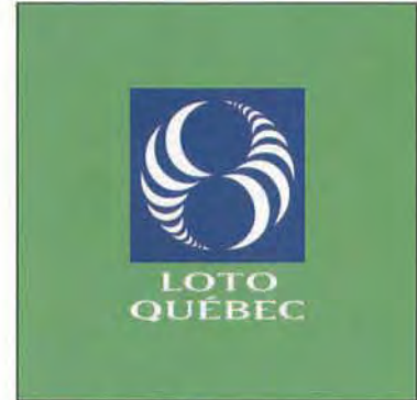
Signature officielle avec dénomination inversée