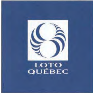
Version bleue inversée