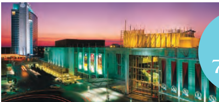
Complexe Lac-Leamy : Casino et hôtel Hilton