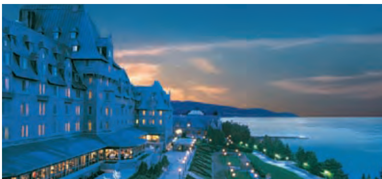
Casino de Charlevoix et hôtel Fairmont Le Manoir Richelieu