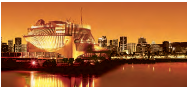
Casino de Montréal